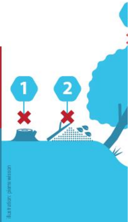
Illustration: pierre wilson

3 Réaliser des coup il est nécessaire de cou poussant en pente sur l avant qu'ils ne se transforment effondrement de la berge. Les participant au bon maintien de