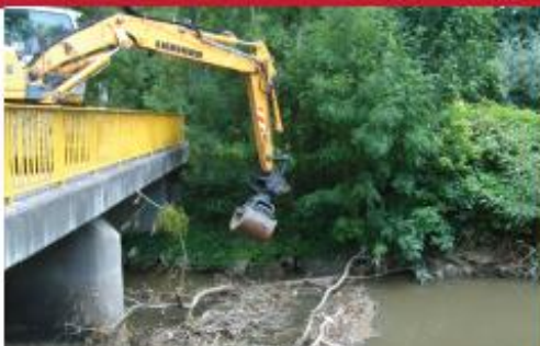
Enlèvement d'embâcle réalisé à WALHEIM en 2011 par le Syndicat Mixte de l'Ill.

! Les collectivités (syndicats mixtes de rivière, Communes ou Intercommunalités) peuvent prescrire ou exécuter les travaux présentant un caractère d'urgence. Le propriétaire doit alors régler le montant des travaux engagés. Les collectivités peuvent également se substituer à l'action des propriétaires, lorsque celle-ci est d'intérêt général ou hors de portée du riverain (loi sur l'eau du 3 janvier 1992).